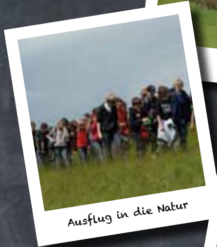
Ausflug in die Natur