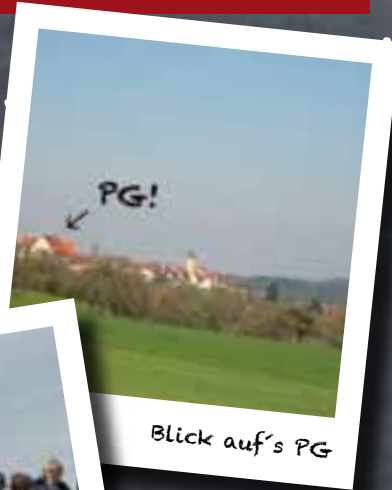
Blick auf's PG