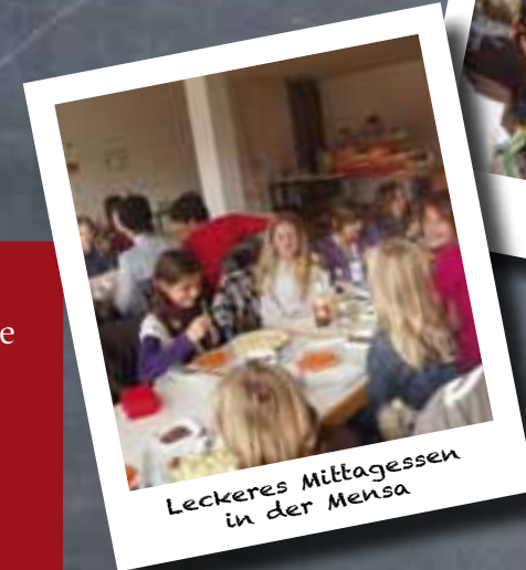
Leckerer Mittagessen in der Mensa