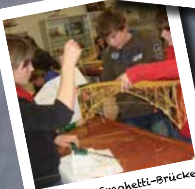
Bau einer Spaghetti-Brücke in NWT

Wir sind zurzeit: 235 Schüler in 11 Klassen (17 - 28 Schüler pro Klasse) 24 Lehrerinnen/Lehrer plus Praktikanten